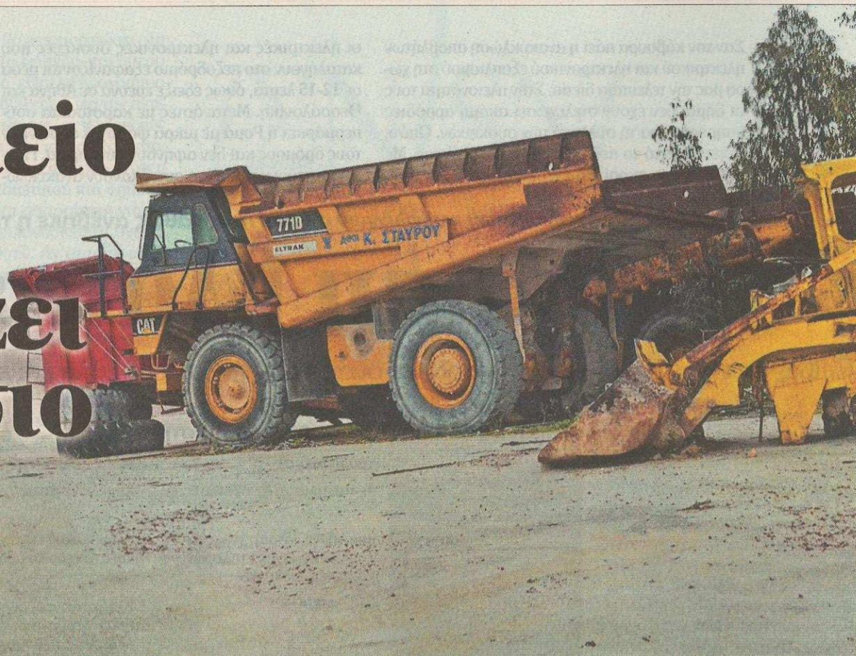
ΦΩΤΟΓΡΑΦΙΑ: ΠΙΣΤΟΣ ΟΙΚΟΝΟΜΟΛΟΓΟΣ

Σκουριάζουν κατασχεμένα μηχανήματα που θα μπορούσαν να εκπονηθούν μέσω ΟΔΔΥ, ενώ σπαταλώνται κονδύλια και δυνάμεις για φρούρηση